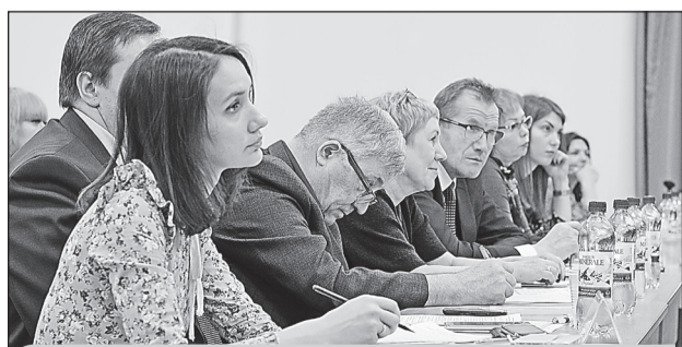
В Самаре выберут лучших преподавателей