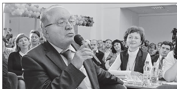
Виктор САДОВНИЧИЙ: «В Большом жюри большую роль играют традиции»