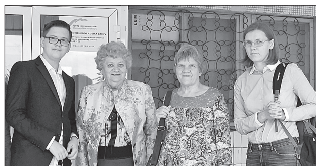
ЕЩЁ ОДИН ШАГ К ВЗАИМОПОНИМАНИЮ

Начальная школа - это такой этап, когда ребёнок перешёл от игры, но не включился ещё во взрослую жизнь. Среднее звено получает от нас детей, готовых к самостоятельной деятельности.