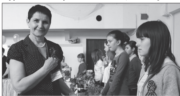
УВЕРЕННЫМИ ШАГАМИ В БИЗНЕС