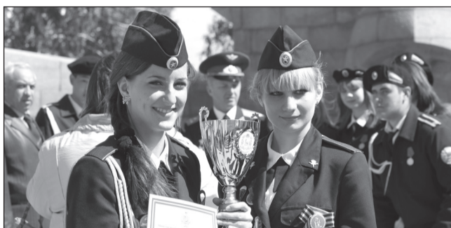
«ЛЮБОВЬ К ИСТОРИИ ОТЧИЗНЫ»