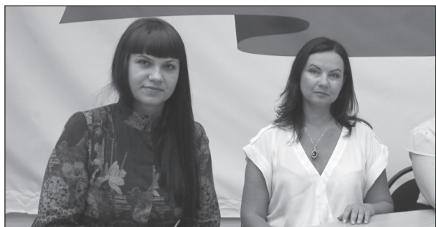
«ВЕДЬ ЛЕТО - ЭТО МАЛЕНЬКАЯ ЖИЗНЬ»