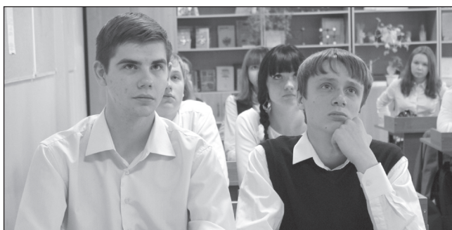
«ЧЕГО МОЖНО ОЖИДАТЬ В ОБРАЗОВАНИИ»