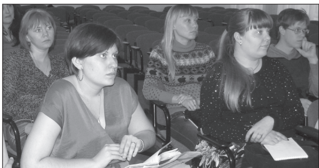
«СОВЕТ МОЛОДЫХ ПЕДАГОГОВ»