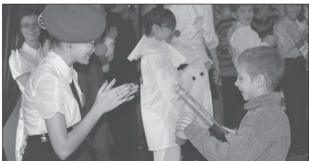
РАДОСТЬ ДЕТСКИХ УЛЫБОК СТР. 3