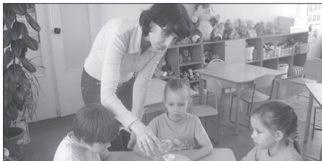
КУДЕСНИК ДЕТСКИХ ОТКРЫТИЙ СТР. 6