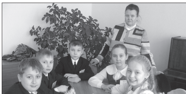
НАСТАВНИК МОЛОДЫХ УЧИТЕЛЕЙ