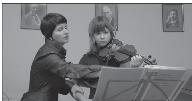
УЧИЛИЩЕ - МОЯ СУДЬБА