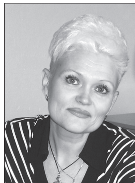
Учитель должен любить своих учеников, а ученики - учителя.

Честность и правдивость также составляют немаловажную часть гражданской позиции учителя. Дети очень высоко ценят честность. «Так нечестно» - это крайне отрицательная оценка в глазах детей. Наш учитель очень