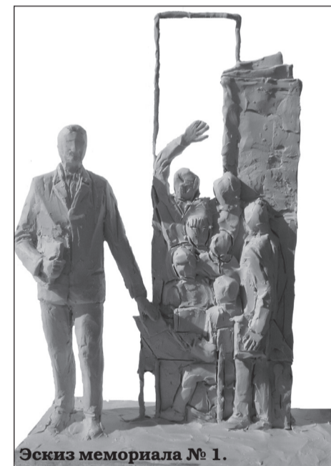
Эскиз мемориала № 1.