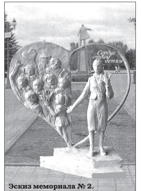
Эскиз мемориала № 2.

В вашем учреждении нет нашей газеты? Спросите у руководителя, почему? Или оформите подписку индивидуально!